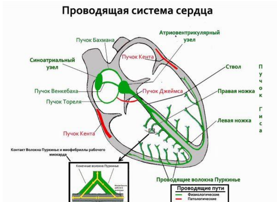
Рисунок 2. Разрез сердца человека

Проверка работы сердца. В упрощенную схему проверки мы включаем также проверку сердца. Именно сердце формирует кровеносной давление человека. За работу сердца в системе В.И. Оконешникова отвечает «Благородный атом» Молибден. Проверку можно проводить по рисунку 2.