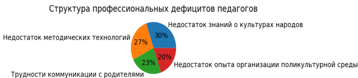
Рисунок 2 - Структура профессиональных дефицитов педагогов

Полученные данные свидетельствуют о необходимости системной работы по развитию межкультурной компетентности педагогов, совершенствованию методического инструментария и развитию навыков межкультурной коммуникации.