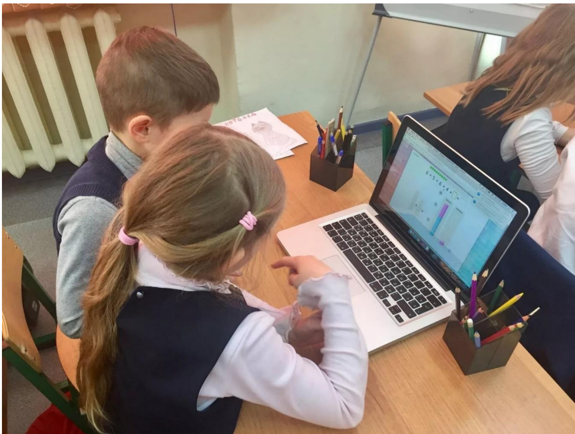
Рисунок 1 – Третьеклассники Старопетровской СОШ при выполнении задания на платформе Учи.ру

Ребята с энтузиазмом вовлекались в захватывающие состязания, развлекательные игры и протяженные марафоны, используя карточки и выполняя проверочные задания. Привлекательные изображения заинтересовывали детей занимательными упражнениями, а спокойные оттенки не утомляли зрение и предотвращали переутомление.