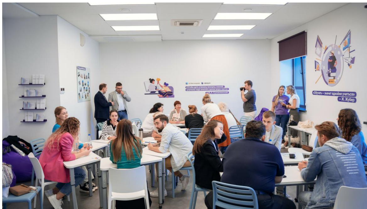
Рисунок 3 – Совместная работа по созданию единого образовательного пространства

В своей работе мы также применяли сетевое взаимодействие между преподавателями и учащимися на платформе Сферум, представляющей собой информационно-образовательную среду для сетевого сообщества и объединяющей учителей, учеников и их родителей. Сферум – это информационно-образовательная система, ориентированная на внутреннюю коммуникацию и сотрудничество между педагогами, школьниками и родителями, а также на организацию дистанционного обучения для учащихся образовательного учреждения. Сферум предоставляет возможности для оперативного обмена информацией, совместной работы над проектами и проведения онлайн-уроков, способствуя созданию единого образовательного пространства.