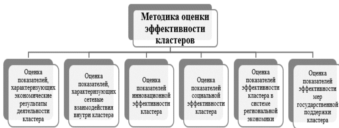
Рисунок 4 - Методика оценки эффективности кластера

9. Для повышения эффективности кластерной политики необходимо усовершенствовать механизм оценки эффективности кластеров в системе региональной экономики. Методика оценки результативности работы кластеров в системе региональной экономики требует повышенного внимания не только с точки зрения экономических результатов деятельности кластера, но и затрат ресурсов, внедрения инноваций, учета социальной составляющей и эффективности мер государственной поддержки кластера, то есть должна быть комплексной и должна включать, по мнению автора оценку групп показателей, представленных на рис. 4.