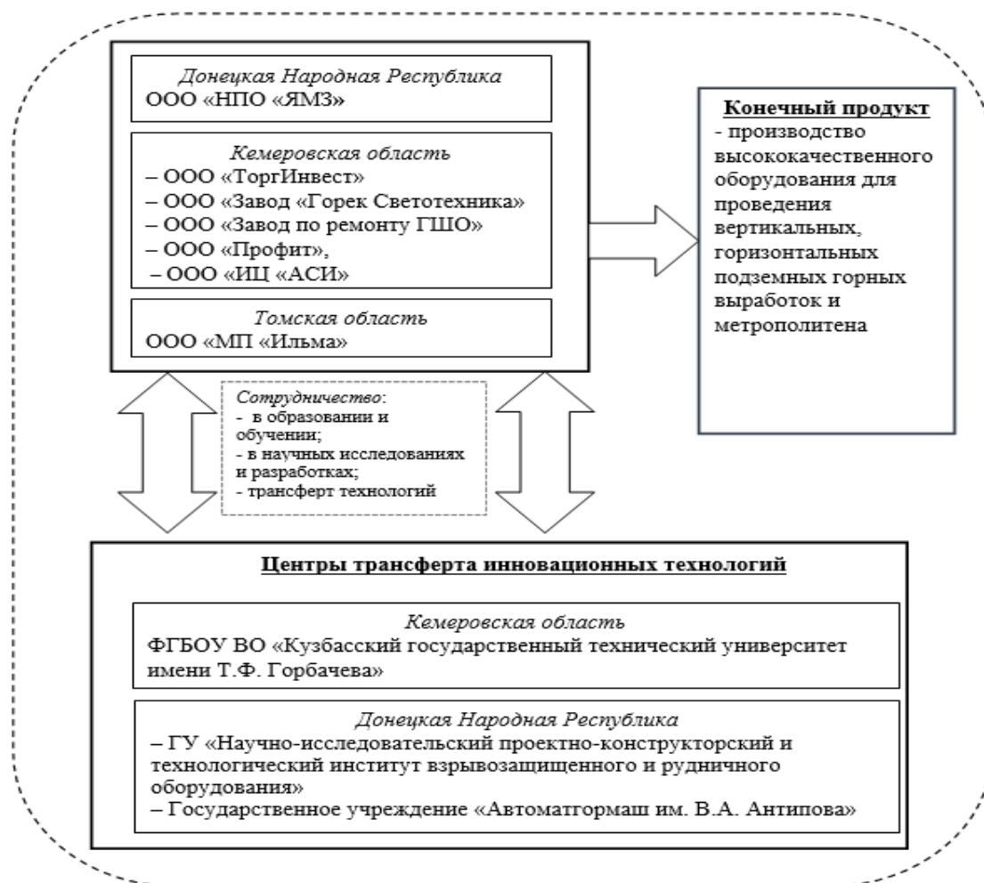
Рисунок 1 - Структура межрегионального промышленного кластера «КЭМЗ»