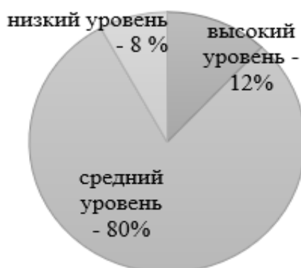
Рисунок 5 - Уровни поликультурного воспитания учителей (по методике Е.В. Емельяненко)

Далее рассмотрим результаты опроса уровня поликультурного воспитания учителей по методике Ю.В. Емельяненко. Согласно опроснику, чем выше количество полученных баллов (максимальное количество 150 баллов), тем выше уровень поликультурного воспитания опрашиваемых. Для удобства обработки нами принята следующая градация результатов: от 0 до 50 баллов – очень низкий уровень, от 51 до 100 баллов – низкий уровень, от 101 до 125 баллов – средний уровень, от 126 до 150 баллов – высокий уровень поликультурного воспитания. Результаты опросника по показателю уровня поликультурного воспитания учителей представлены на рисунке 5.