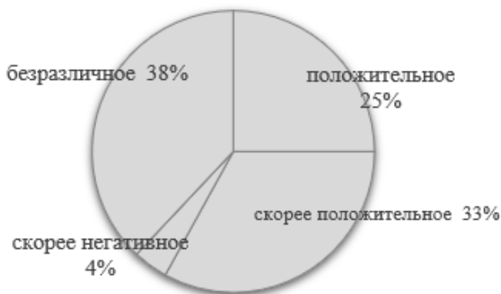
Рисунок 1 - Отношение учителей к мигрантам, %

Почти половина учителей считают, что приток мигрантов создает культурное многообразие в Новосибирске и Новосибирской области, почти столько же учителей затрудняются с ответом, то есть, вероятно, не имеют определенной позиции по отношению к миграции людей из других стран. При этом никто из опрошенных не имеет негативного отношения к мигрантам, хотя существенным представляется число учителей, безразличных к мигрантам – 38 %. (рисунок 1). Безразличие учителя непременно сказывается на понимании детей мигрантов как особой категории учащихся, нуждающихся в индивидуальном подходе.