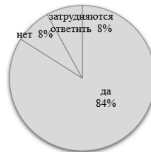
Рисунок 4 - Необходимость, по мнению учителей, тьюторов для детей мигрантов, %