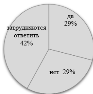
Рисунок 3 - Необходимость, по мнению учителей, отдельных классов для детей мигрантов, %