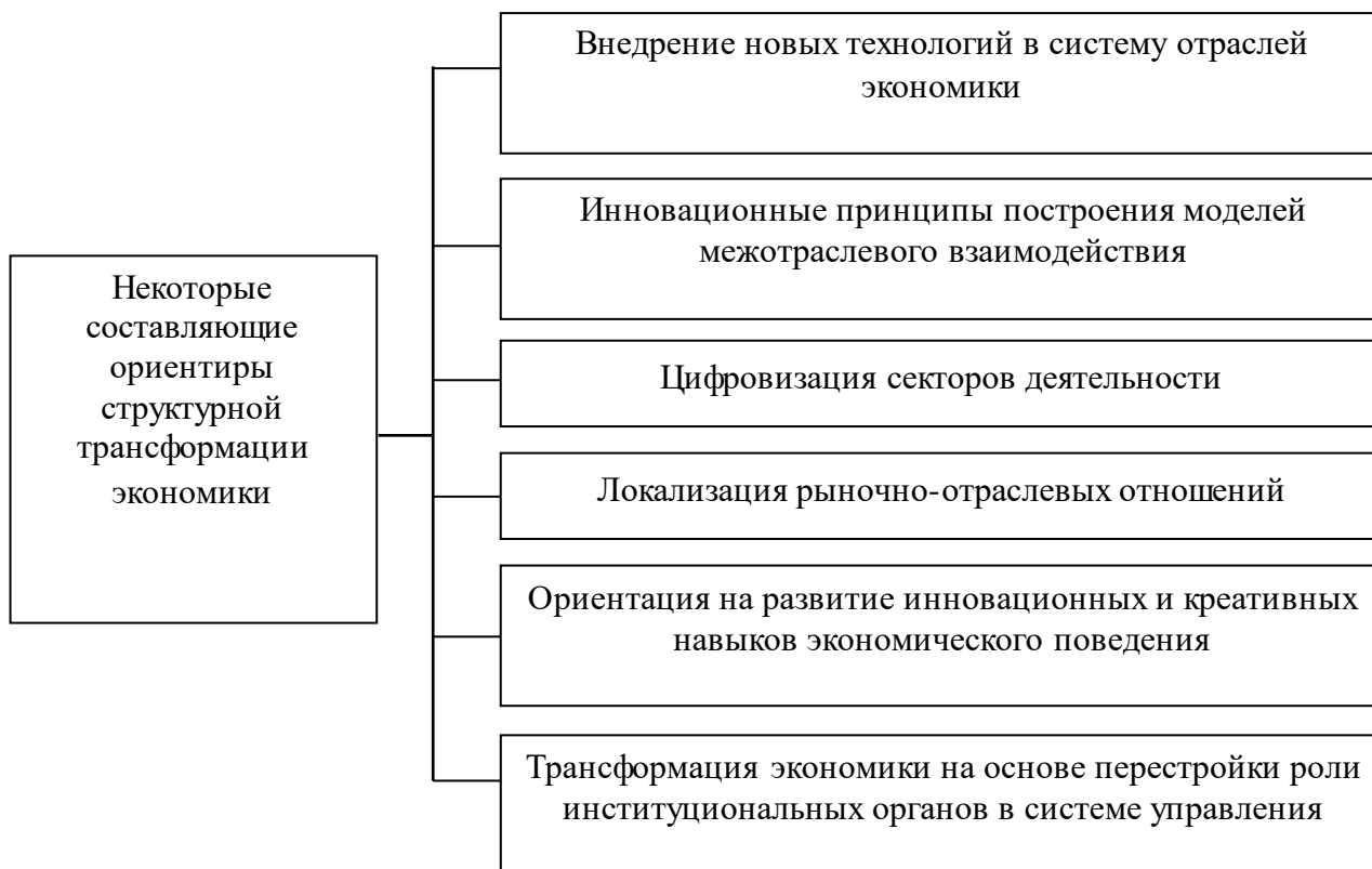
Рисунок 2 - Составляющие ориентиры структурной трансформации экономики

Авторский подход к соотношению рассмотренных выше понятий, а также к обоснованию логики структурной трансформации экономики представлен на рисунке 2, трансформационные процессы в экономической системе могут происходить, как отмечалось выше, под влиянием ориентиров (факторов), как объективных, так и субъективных детерминант. Субъективным фактором является сознательное волевое влияние людей, направленное на ее изменение, что означает реформирование системы. Однако трансформация может быть следствием постепенных (эволюционных) процессов, проявляющихся в количественных, и, соответственно, качественных изменениях системы. Следует согласиться с утверждением О. Буклемишева [8], что трансформация – это не просто приспособление (мимикрия) какой-то системы к условиям хозяйствования, а замена предыдущей экономической системы качественно новой (системная трансформация) или значительные качественные изменения экономической системы, в результате которых возникает и начинает действовать новый хозяйственный механизм (внутрисистемная трансформация).