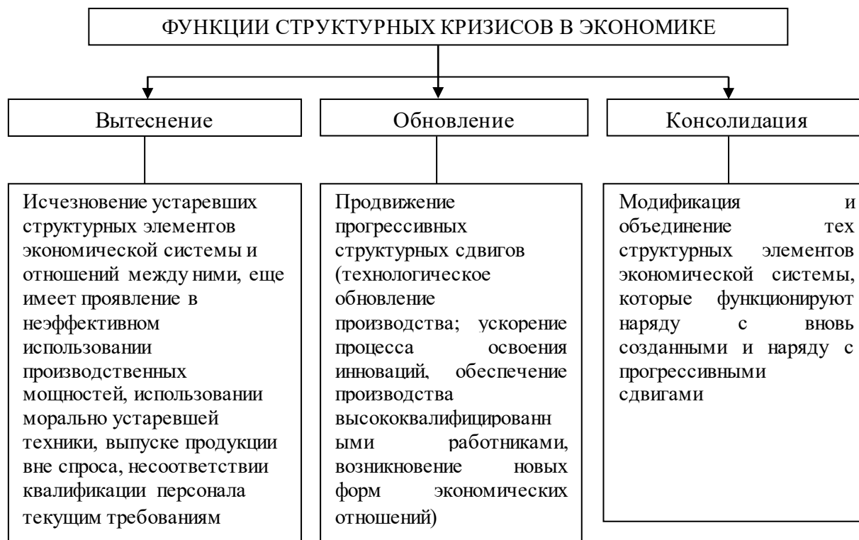
Рисунок 1 - Функции структурных кризисов в экономике

Весомое место также занимают инновации, инициирующие структурную перестройку экономики в целом для обеспечения прогрессивного экономического роста страны. Все это обуславливает переход капитала из действующих производств к вновь созданным. В итоге структурные кризисы выполняют ряд важных функций, которые можно привести на рисунке 1.