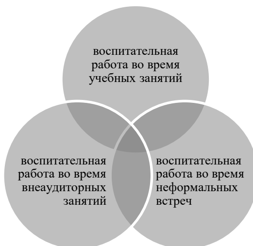
Рисунок 3 – Направления воспитательной работы с иностранными студентами

Воспитательная работа с иностранными студентами идет по трем направлениям: во время учебных занятий, во время внеаудиторных занятий и во время неформальных встреч (рис.3).