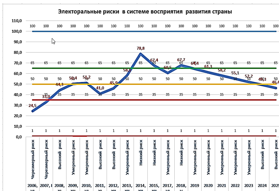
Рисунок 4 - Прогнозная динамика развития электоральных рисков (2018-2025 г.г.) (получена автором)

числе ситуаций наиболее эффективно и бесконфликтно. Так называемые народные предприятия становятся все более популярными в США и Европе. 3