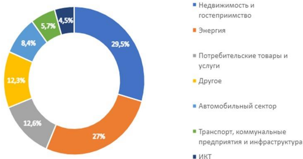
Рисунок 2 - Китайские ПИИ во Франции по секторам (2000-2016)

Инвестиции в чувствительные сектора, однако, подлежат автоматическому процессу отбора. К таким секторам относятся энергетика, водоснабжение, транспорт, телекоммуникации, здравоохранение и оборону. В 2018 году французы еще больше расширили перечень чувствительных секторов, в которых будут рассматриваться ПИИ. Дополнительными целевыми секторами являются кибербезопасность, искусственный интеллект, робототехника, полупроводники и космические операции. 5