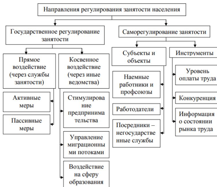
Рисунок 5 – Направления регулирования занятости населения

С учетом обобщенного материала перейдем к анализу направлений государственного регулирования занятости населения. В общем виде систему регулирования занятости населения можно представить в виде схемы, изображенной на рисунке 5.