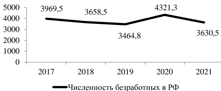
Рисунок 3 – Динамика численности безработных в РФ за 2017-2021 гг., тыс. чел. (Источник: составлено по данным Росстата, URL: https://rosstat.gov.ru/labour_force )

Анализ данных, представленных на графике, подтвердил ранее выдвинутое предположение о скачке безработицы в 2020 г., обусловленное эпидемиологическими ограничениями. Самые низкие значения безработицы (в течение рассматриваемого периода) наблюдались в докризисном 2019 г., но в целом за пять лет число безработных сократилось на 339,5 тыс. чел. (8,54% к уровню 2017 г.). Такая динамика показателя на фоне снижения численности трудоспособного населения может указывать на сокращение общей численности населения, снижение доли трудоспособного населения в общей численности, что не характеризует динамику рынка труда с положительной стороны [11].