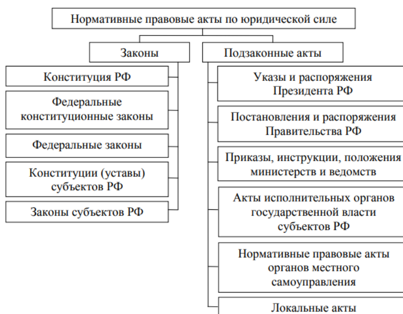
Рисунок 1 – Система нормативного регулирования занятости населения

В обобщенном виде систему нормативного регулирования занятости населения можно представить в следующем виде (рис.1).