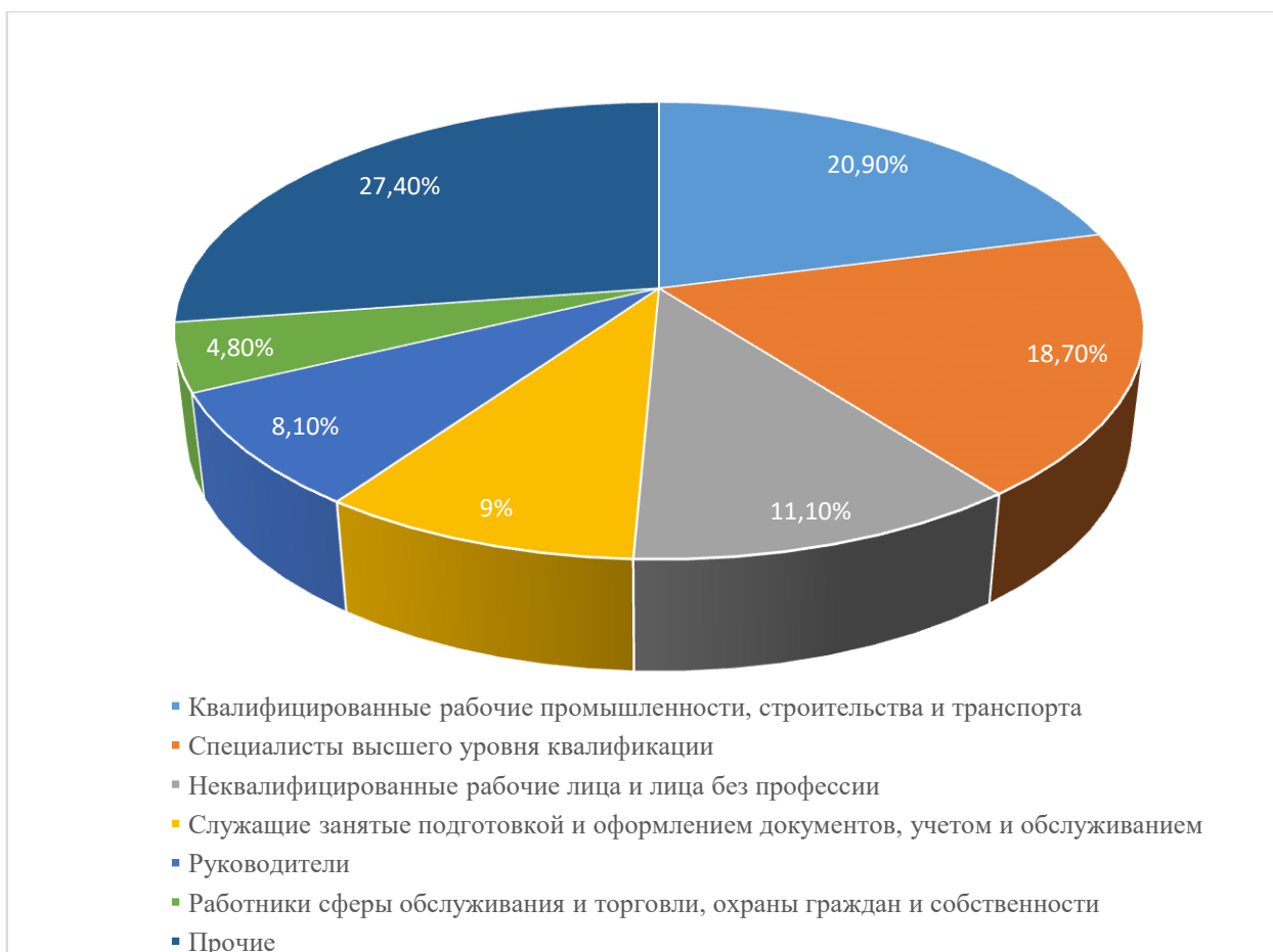
Рисунок 2 – Потребность в рабочей силе в 2021 году

По данным Республиканского центра занятости Донецкой Народной Республики, в 2021 году большим спросом пользовались квалифицированные рабочие промышленности, строительства и транспорта – 20,9%, специалисты высшего уровня квалификации – 18,7%, неквалифицированные рабочие лица и лица без профессии – 11,1%, служащие занятые подготовкой и оформлением документов, учетом и обслуживанием – 9%, руководители – 8,1%, работники сферы обслуживания и торговли, охраны граждан и собственности – 4,8%, на прочие сферы занятости приходится 27,4% (рис. 2).