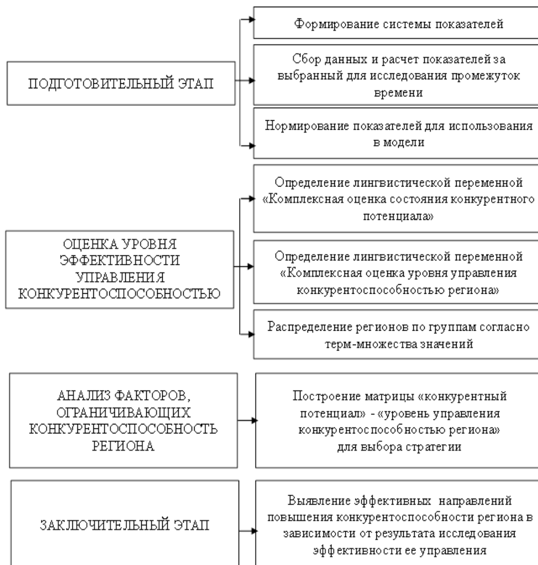
Рисунок 2- Алгоритм реализации метода оценки управления конкурентоспособностью региона

При проведении оценки уровня управления конкурентоспособностью региона на основе вышеприведенных показателей предлагается использовать элементы теории нечетких множеств. Это позволит более точно провести оценку эффективности управления конкурентоспособностью регионов в условиях неопределенности.