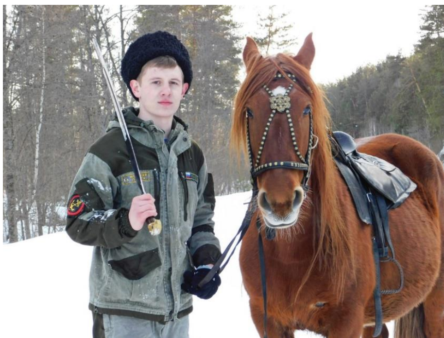
Рисунок 3 - Казак Авзянской школы во время зимних военных учений

В течение учебного года проводятся внеклассные патриотические мероприятия, встречи с ветеранами боевых действий, интересными людьми. Безусловно, данную работу необходимо продолжать и развивать. Большую поддержку по развитию казачества в районе оказывает Центр туризма г. Белорецка, который привлекает ребят на казачьи слеты, где школьники учатся жить на природе, приобретают основные навыки для выживания в дикой природе (рис.4).