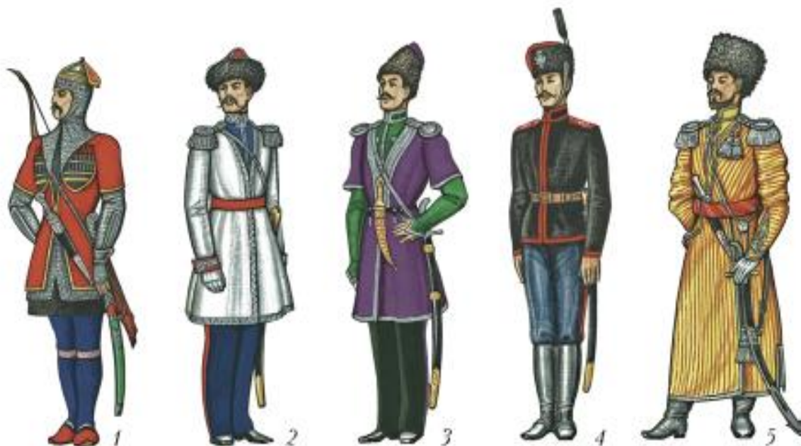
Рисунок 1 - Военная форма башкирских казаков [10, с.45]

В 1798—1803 гг. было 11 башкирских и 5 мещерякских кантонов. В 1803 г. был образован ещё один башкирский кантон путём выделения в самостоятельную административную единицу башкир Шадринского уезда и их стало 12 (в Бугульминском и Белебеевском уездах — 12-й кантон). В 1834 году военный губернатор Оренбургского края Перовский В.А. подчинил Башкиро-мещерякское войско военным властям. Командующим войском был назначен полковник Циолковский Т.С. Башкирские казаки службу несли за собственный счет. На службу башкир снаряжали по очереди от 20 до 50 лет [12, с. 3].