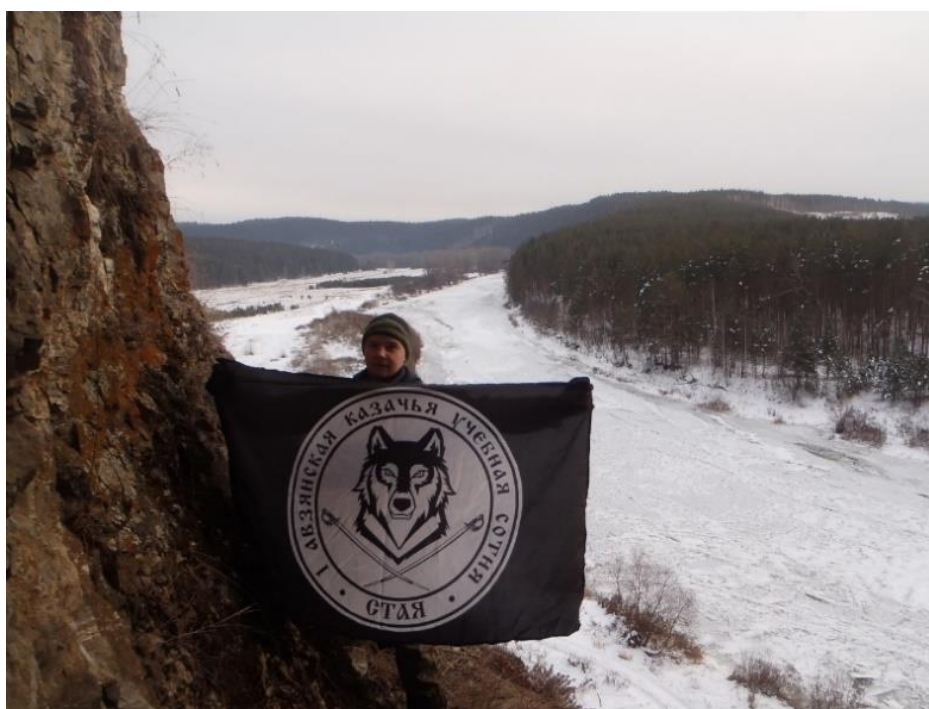
Рисунок 4 - Изучение природы родного края казаками во время каникул

В течение учебного года проводятся внеклассные патриотические мероприятия, встречи с ветеранами боевых действий, интересными людьми. Безусловно, данную работу необходимо продолжать и развивать. Большую поддержку по развитию казачества в районе оказывает Центр туризма г. Белорецка, который привлекает ребят на казачьи слеты, где школьники учатся жить на природе, приобретают основные навыки для выживания в дикой природе (рис.4).