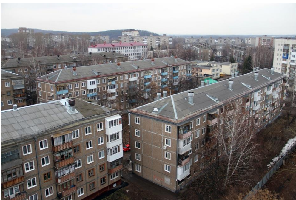
Рис.3 - «Хрущевки» г. Уфа по улице М. Гафури

В конце 1940-х гг. был принят генеральный план реконструкции и развития Уфы. Многоэтажную застройку планировали вести в центре и вдоль дороги Уфа – Черниковск. По генплану развития Уфы основными местами жилой застройки стали кварталы проспекта Октября. Унифицированное строительство привело к почти полной потере индивидуального облика Уфы, утрате ее регионального колорита. Конечно, главная идея заключалась в том, чтоб переселить людей из бараков и коммуналок в отдельные квартиры. Общий вид «хрущевок» не особенно привлекает современных людей, особенно молодое поколение, так как предоставляет очень узкие возможности проявить мастерство дизайнера и воплотить оригинальные идеи, чтобы создать свое, уникальное и современное, модное жилье. Таким образом, квартиры в домах-«хрущевках» теряют свою ценность с каждым годом, а также не имеют особенного спроса у потребителей (рис.3) [10].