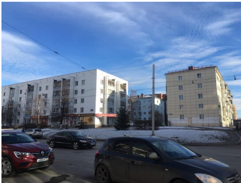
Рис.4 - Ленинский район г. Уфа

Ведь именно благодаря «хрущевкам» многие советские, а потом и российские граждане обрели дом. «Хрущевки», как архитектурное творение стали достопримечательностью городов, частью его истории. Сейчас без них сложно представить многие города, мы убедились в этом, рассмотрев в качестве примера г. Уфа - город миллионер по числу жителей. Сегодня «хрущевки» — это не только дома, это целая эпоха, особый лист в страницах истории каждого города нашей страны [24].