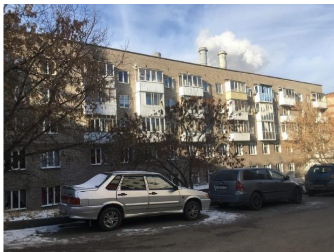
Рис.1 - «Хрущевки» г.Уфа, Телецентр

Многие уфимские архитекторы считают, что, если вдруг придет директива из федерального центра немедленно расправиться с «хрущевками», Уфы просто не останется. О том, что может появиться на их месте, специалисты даже не осмеливаются предполагать. Сейчас взамен «хрущевкам» предлагают «муравейники» небоскребы. Срок службы кирпичной «хрущевки» – порядка 100 лет, панельной – 70-80 лет. Нетрудно посчитать, что первые проблемы могут возникнуть уже к 2025 году. Однако отметим, что опасения в отношении долговечности «хрущевок» большинство специалистов подтверждают лишь отчасти. Главная проблема в том, что практически в 90 процентах из 100 собственники квартир в «хрущевках» при ремонте делают там перепланировку [23]. Это связано с тем, что сама планировка в «хрущевках» очень неудобная: комнаты проходные, кухни маленькие – порядка шести квадратных метров. Чаще всего уфимцы убирают перегородку между кухней и залом, чтобы сделать единое жилое пространство. Многие пытаются сделать из проходной комнаты, если это «двушка», изолированную. Плюс частенько бывает, что увеличивают санузлы, так как они там очень миниатюрны (рис.2).